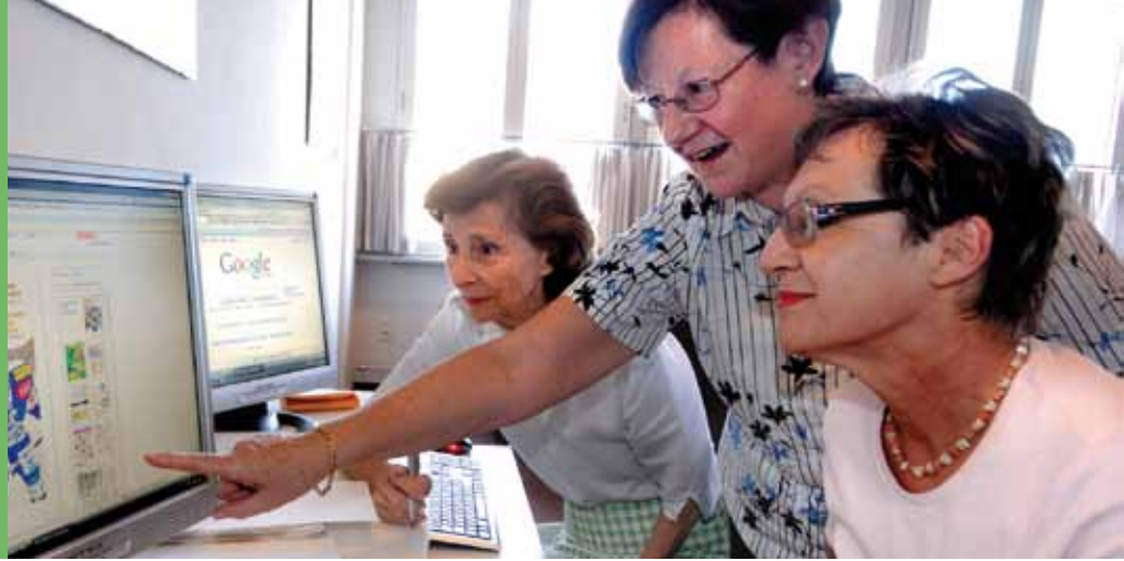
Bildung und Kultur: Computerkurse